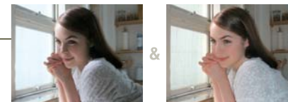
Luz natural (flash desactivado)

Si no puede decidir si debe emplear el flash o no, puede utilizar el modo Luz Natural & con Flash. En este modo, la cámara toma dos fotos en rápida sucesión, una con flash y otra sin, para que pueda elegir y guardar la que más le guste.