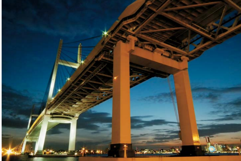
24mm La ventaja de un objetivo gran angular de 24mm permite captar paisajes dinámicos y vistas de gran amplitud.