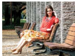
Zoom óptico 10x