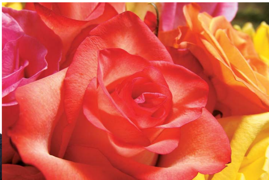
Macro El enfoque macro de hasta 2cm permite llenar el fotograma con imágenes de asombroso detalle.