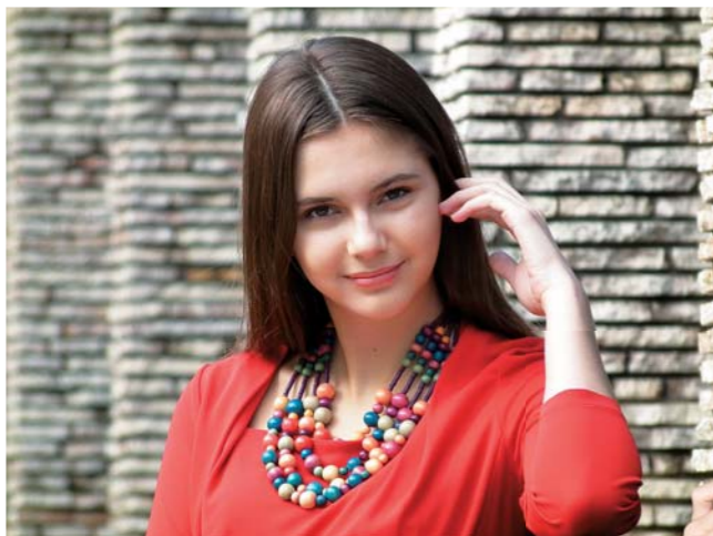
Zoom óptico 30x