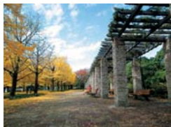
Gran angular 24mm

Equipada con un objetivo zoom súper largo Fujinon 30x, la FinePix S4000 ofrece un rendimiento extraordinariamente versátil. El fluido control del zoom en 45 pasos, desde gran angular de 24mm hasta una impresionante posición teleobjetivo 30x, permite encuadrar cada imagen con gran precisión.