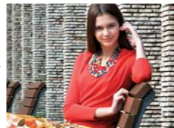
Zoom óptico 20x